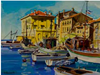
Hafen, Jugoslawien, 1954, 54 x 68 cm