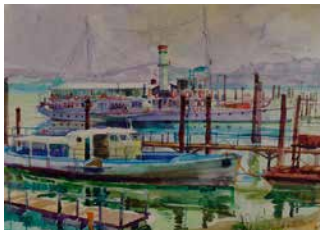
Ausflugsschiffe, 1980, 48 x 68 cm