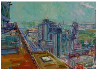
Industriellandschaft, 1991, 55 x 77 cm

Zur Midissage Sonntag, 6. Mai 2018 15:00 Uhr